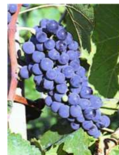
Couderc ou Seibel 1077